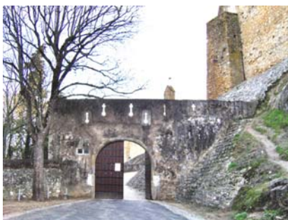
Porta de Santiago

Até lá terás de manter silêncio , pois estão outros visitantes no monumento, que devemos respeitar.