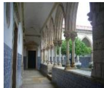
Claustro do Cemitério